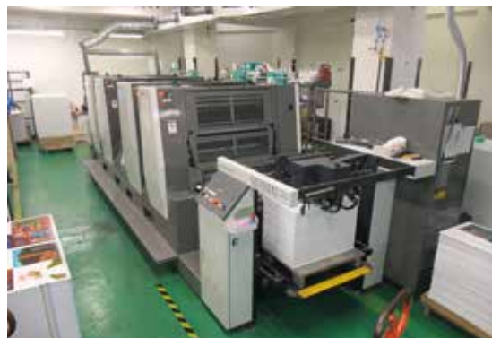
キレイナを使っている菊半裁判4/0・2/2反転機。右奥に印刷機横の特注のステップや手すりがあり、その上に少し見えているのが手すりの上にある備品棚

くまで様子を見ていた。また、ジャパンカラーを認証取得していたため油性インキとUVインキとの印刷物のカラーマッチングも気になっていた。