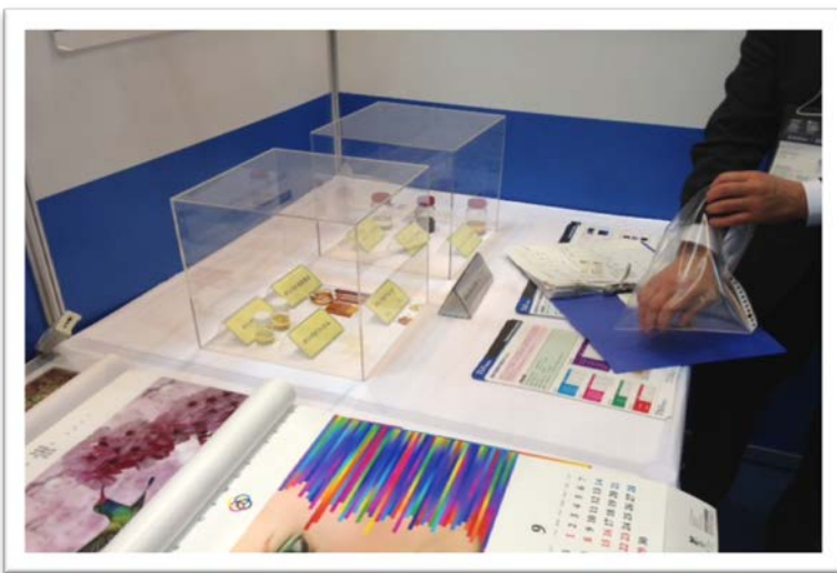
液状潜在性エポキシ樹脂硬化剤 & 汎用溶剤可溶型熱可塑性ポリイミド